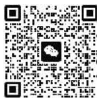
扫码加入 “尔滨追花”群

更多花卉,有待我们以花为媒,共同探寻,一起发掘并展示哈尔滨的自然风光之美、城市人文之美。