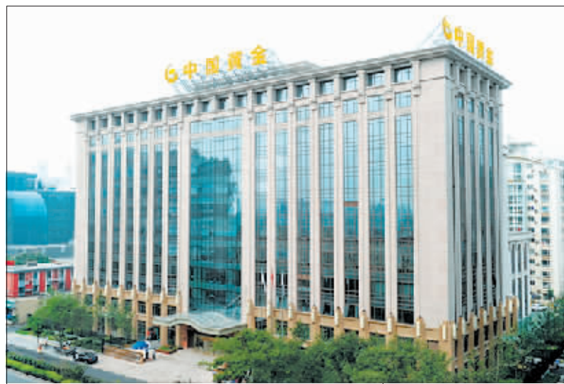
店门紧闭的北京富力广场中国黄金加盟店。

管”遭受了重大损失,那么,金店从事黄金托管业务是否违规?所谓黄金托管,是指个人或机构将自己持有的黄金交由金融机构进行保管,由金融机构进行黄金的收购、保管、销售等业务,托管人可以通过证券账户购买黄金,也可以将手中的实物黄金交由金融机构进行保管。