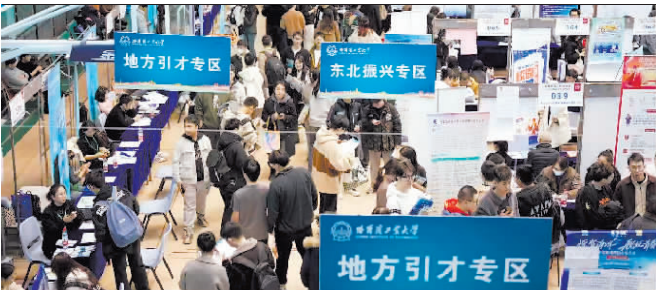
在哈工大举行的人才招聘会。