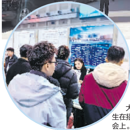
大学生在招聘会上。

司，公司朝气蓬勃，“发展势头很好”。生活上，她跟父母一起，互相照顾，有房有车，没有后顾之忧。她很感慨：“在外漂着的朋友都很羡慕我有这么好的机会，可以回哈尔滨工作。”