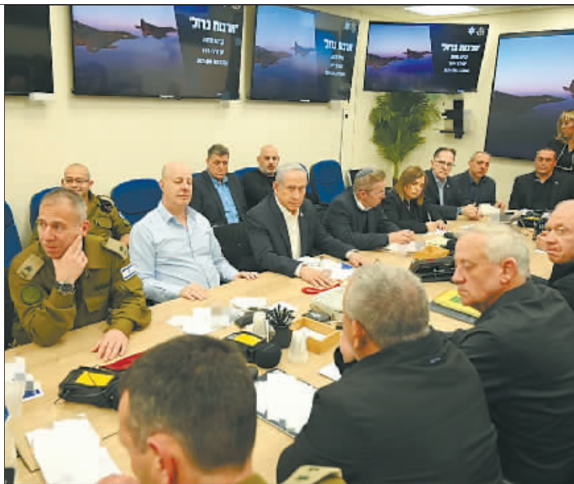
以色列总理内塔尼亚胡在位于特拉维夫的以色列国防部召开战时内阁会议。

首先,以色列的最大靠山美国反对反击伊朗。拜登在14日与内塔尼亚胡的通话中表示,美国将反对以色列对伊朗