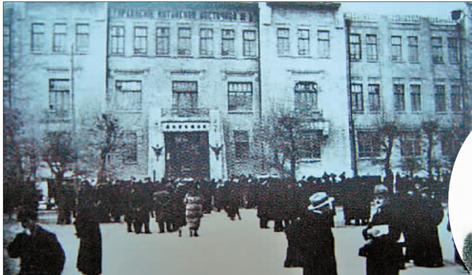
▲20世纪初的中东铁路管理局。