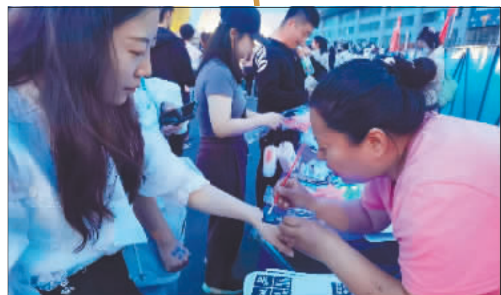
“演出+文旅”燃情哈尔滨春日。

他特意给哈尔滨准备了特色节目——转手绢,边转边唱,表演完了把手绢丢给台下一名歌迷,并开玩笑让对方“回家练练”,没想到人家咋咋转得比他还好。嘉宾龚俊特意推了工作赶来哈尔滨,李荣浩特别感动,“我给他安排了铁锅炖”。龚俊唱歌跑调,被大家戏称“人间百灵鸟”,但在哈尔滨唱的这首《乌梅子酱》有模有样,跑得不明显。