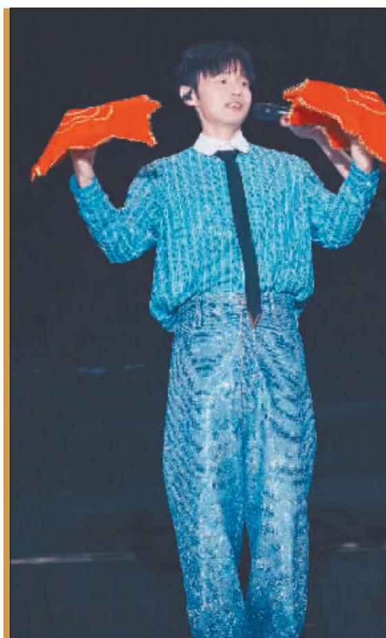
李荣浩表演转手绢。

“为一场演出,奔赴一座城”,现在像李女士这样跨城观演的歌迷越来越多。2023年以来,中国演出市场强劲复苏,旅游市场也同步出现井喷态势,淄博、西安、哈尔滨陆续成为“顶流”,“跟着演出去旅行”成为流行趋势。国内权威平台监测数据显示,2023年以来,国内演艺市场需求旺盛,大型演唱会跨城观演比例高达68%,演唱会正在成为消费新引擎。像李女士这样年轻的歌迷旅游通常会住1至3天,打卡网红美食店、去热门景点及购买土特产,吃、住、玩全方位拉动演出城市的经济,一个人能带来至少几千元甚至上万元的收入。去年冬天哈尔滨的爆火让这座城市热情好客的形象深入人心,李荣浩演唱会可以说促成了外地歌迷与冰城的双向奔赴。