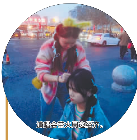
演唱会带火周边经济。