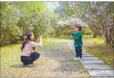
深浅错落，清香浮动，风暖人间草木香。