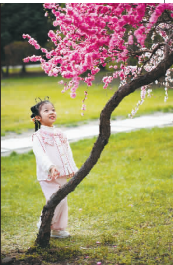
花开时节，将热忱藏进每一帧岁月。