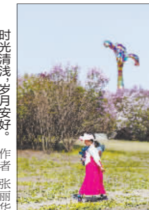
时光清浅，岁月安好。