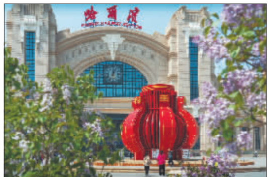
用一次灿烂的遇见，点亮一整年的灼灼记忆。