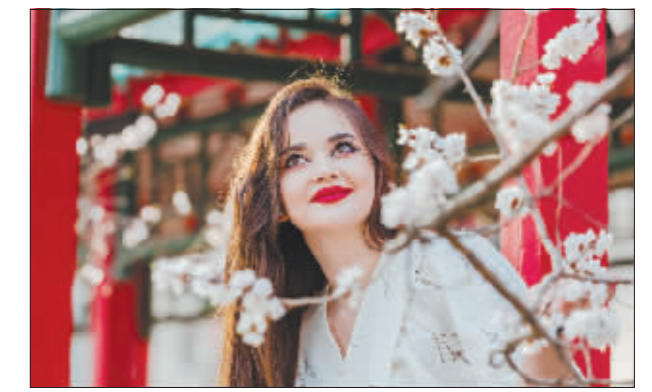
顾盼于树梢，宛宛如于眉梢。