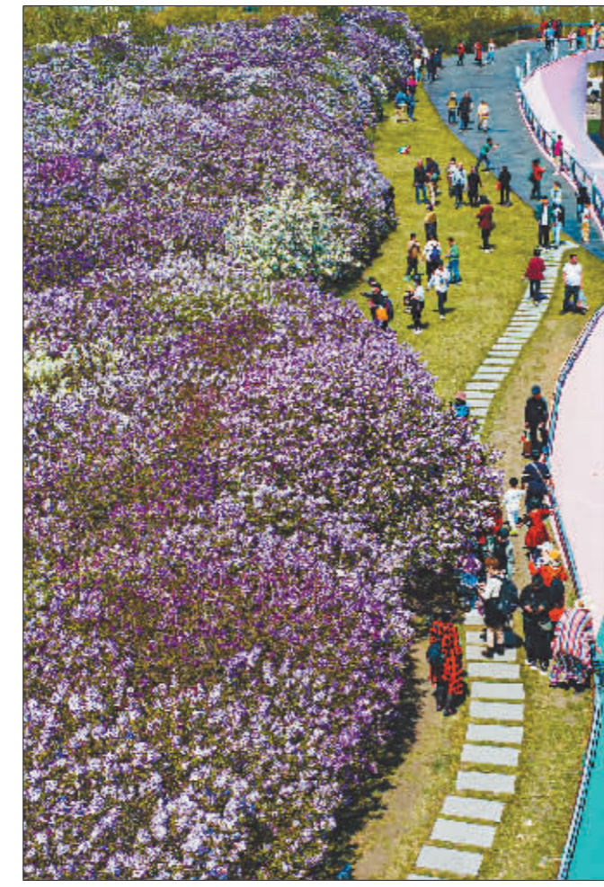
一场热烈的盛放，是丁香写就的纸短情长。