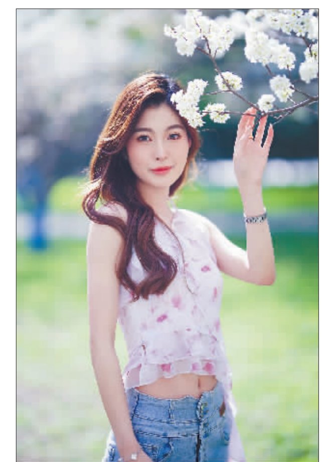
风暖昼长，草长莺飞，花开成景，花落成诗。