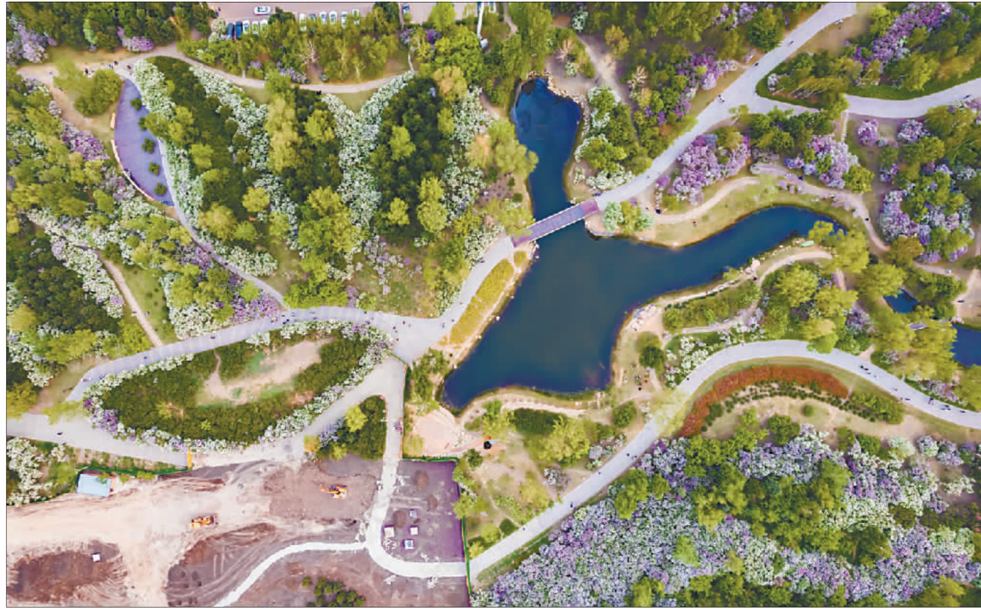
初夏的味道，是一树一树盛放的丁香，在碧空下随风摇曳，铺展出一片馥郁芬芳。

发现记录哈尔滨四季之美，展示绿色生态之城、宜居幸福之都的崭新面貌，由哈尔滨日报社、哈尔滨市文学艺术界联合会、哈尔滨市摄影家协会联合举办的“大美冰城 四季映像”主题摄影、短视频作品有奖征集活动已启动近两个月，收到市民和外地游客拍摄的作品近万幅。佳作无数，敬请欣赏。