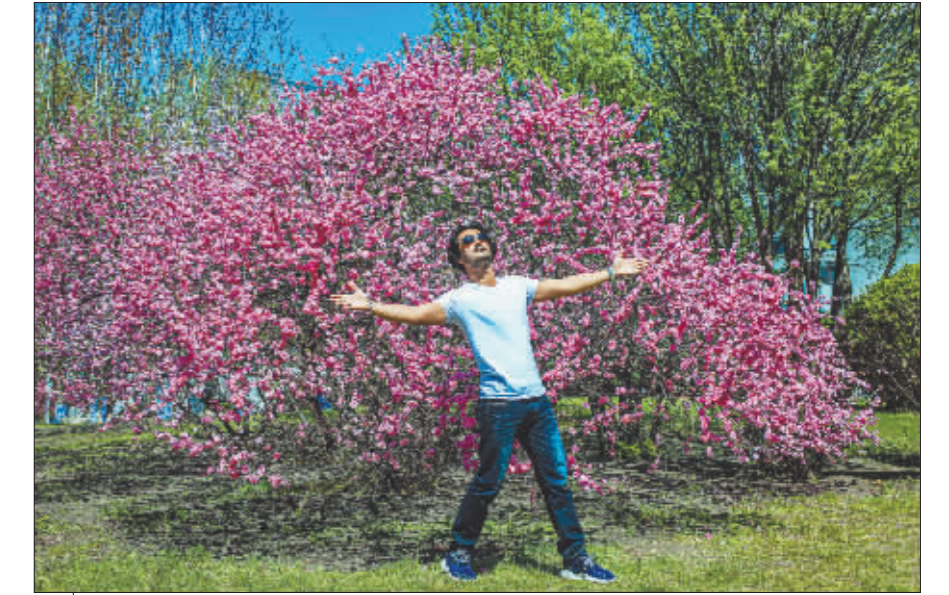
我想要怒放的生命。