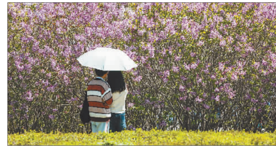
和你爱的人一起看“尔滨”花开，享受芬芳时光。