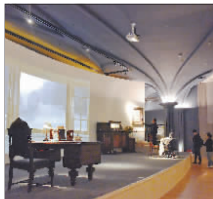
展览还原上世纪俄罗斯家庭生活场景。

随着人流向前,记者看到了一幅哈尔滨最早的商业广告——久滨布庄广告。20世纪20年代,哈尔滨已经成为远东国际贸易中心,商业和工业都得到了快速发展。这则广告是上世纪哈尔滨商业起步发展的缩影。