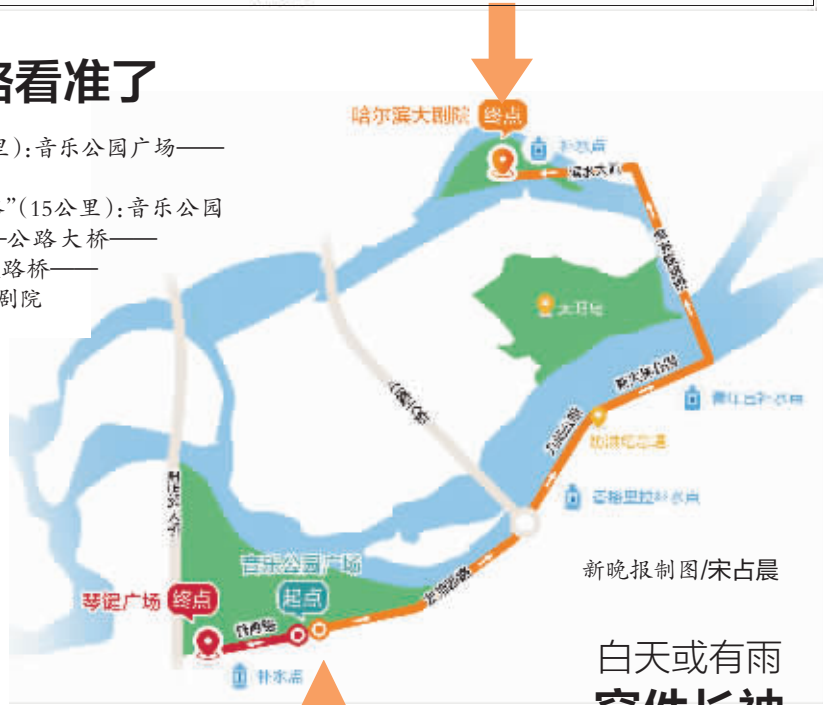
新晚报制图/宋占晨