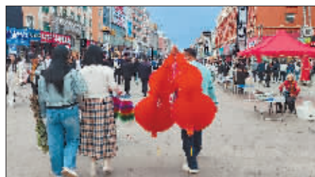
一年一端午，一岁一安康。