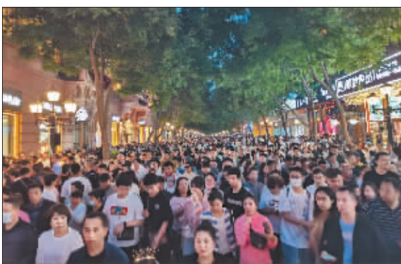
万人齐聚，汇成最亮丽风景线。