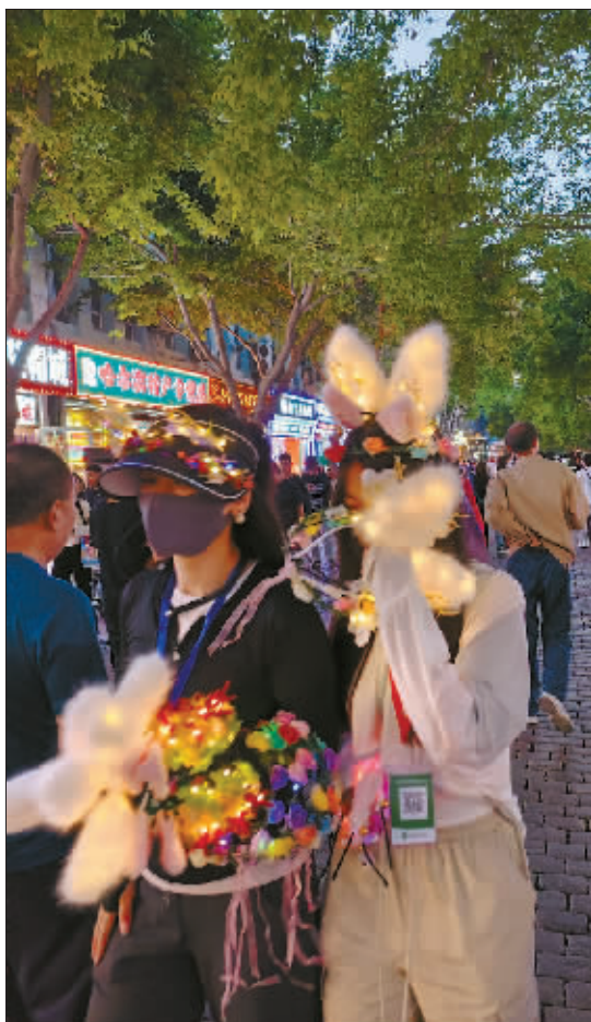
我的浪漫，醉透了街景。