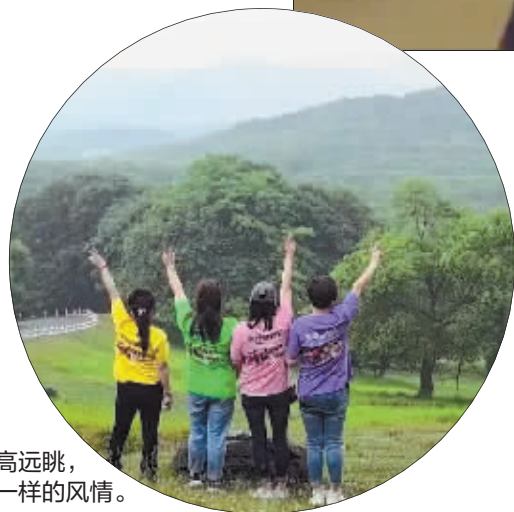
登高远眺，不一样的风情。