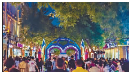
灯光璀璨，照亮冰城不夜天。