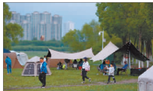
聚餐露营，“粽”享湿地风光。