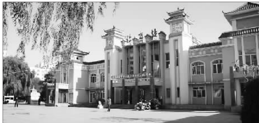
▲现今儿童公园里的“北京站”。

精准、故事情节丰富、可读性强等。3. 稿件请发送至22354430@qq.com，同时请注明姓名、个人简介（100字以内）、联系方式。