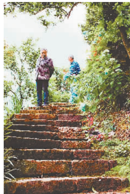
为了方便卢大妈行走,张大爷将土路修上了石梯。