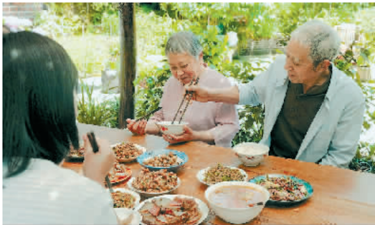
张大爷给卢大妈夹菜。