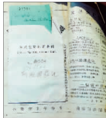
1923年的《新青年》首次刊登的《国际歌》。1922年商务印书馆印行的《新俄国游记》。