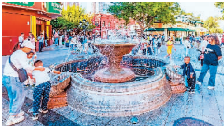
摄影《清凉一夏》 作者 张本盛