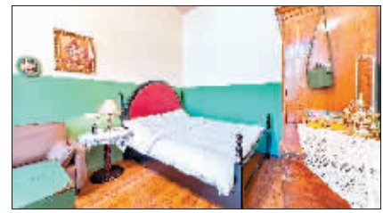
老式设计的民宿,让游客觉得很新鲜。

悬挂着哈尔滨老照片、以地标建筑为蓝本的俄罗斯油画……这里仿佛是一个老照片博物馆、俄罗斯油画展会。