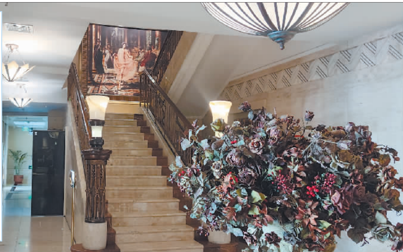
哈尔滨国际饭店大堂,历史与文化交融。

现在,许多“久经沙场”的商家反应够迅速——搭建消费新场景、提供特色化服务,将城市内涵与地域特色融入“一间房”中、“一张床”上,让游客深切感受到“住”的不仅仅是酒店、民宿,而是住进了冰城。