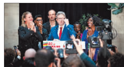
7日，法国极左翼政党“不屈法国”领导人梅朗雄(中)出席选后集会。

此外，法国政治的不确定性引发企业担忧。法国中小企业联合会调查结果显示，35%企业认为政治稳定是当务之急，47%企业担心未来几个月业务量下降。