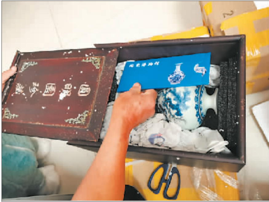
韦怡公公在直播间购买的“假古董”。

记者调查发现，7月9日晚，视频账号“天龙御瓷5号”中主播正在带货，除了展示“宝物”，他还拿出手机展示保利公司的