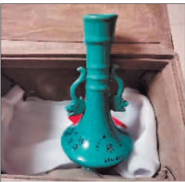
主播展示的一件“藏品”。