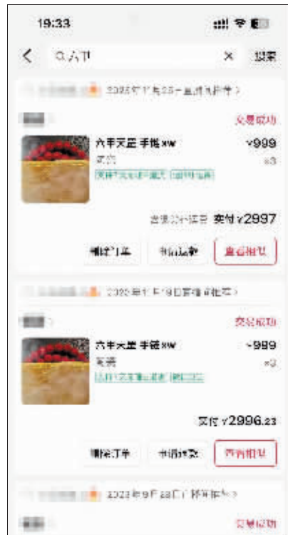
一些店铺消失，无法退货的订单。