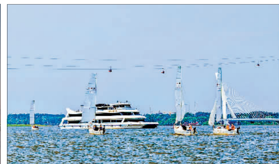
风正扬帆 作者:张晓青