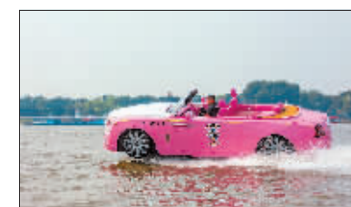
纵横驰骋 作者:刘俊华