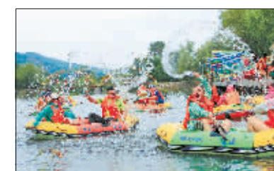
激流勇进 作者:王波