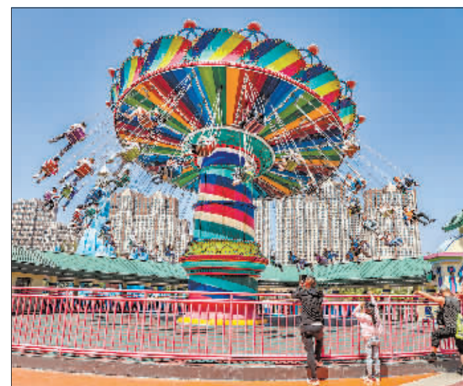
奇幻乐园 作者:刘敬东