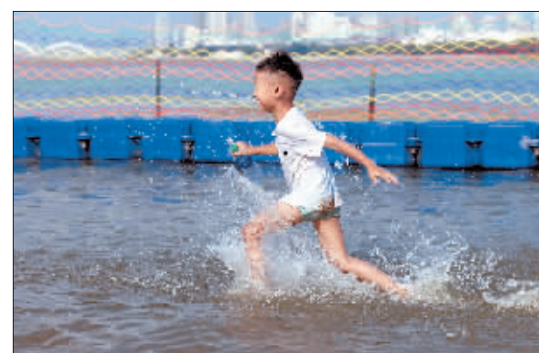
花样戏水 作者:赵春霞(组照)