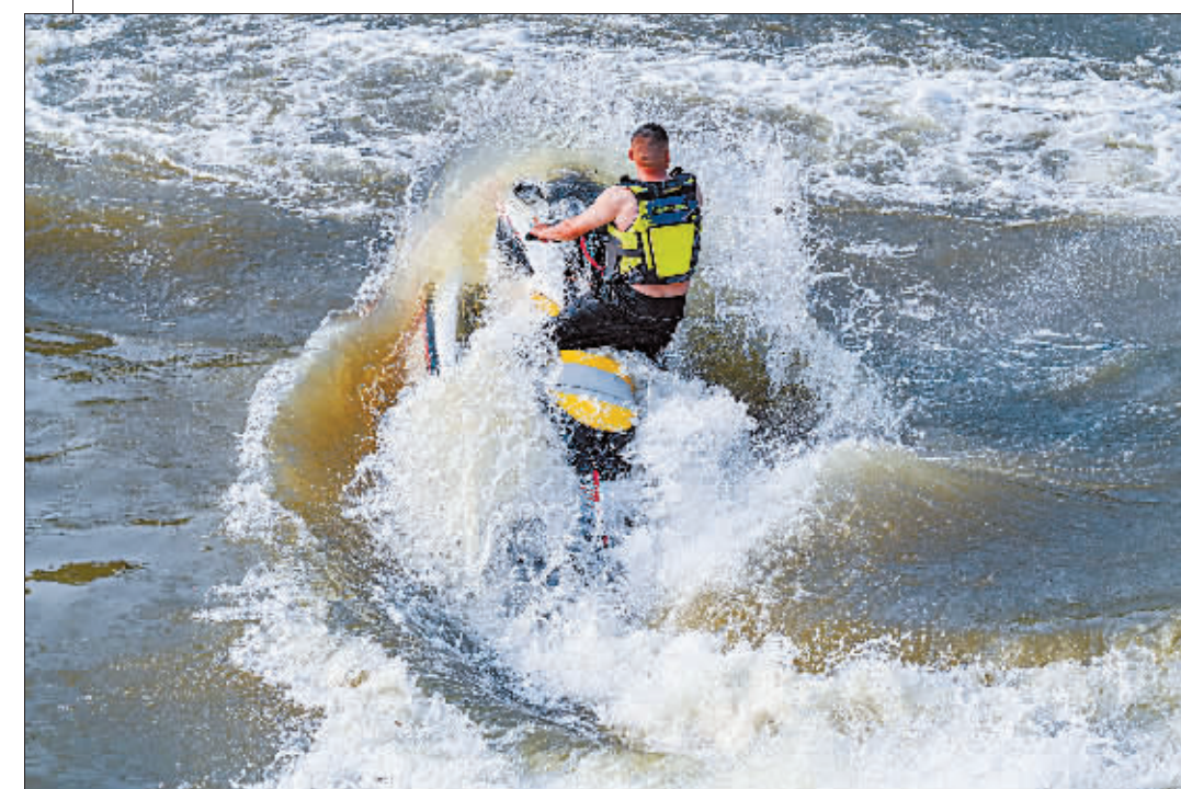
破浪前行 作者:高广瑞