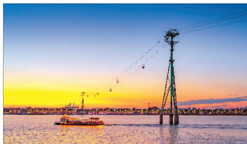
江上夜航 作者:王小兵

“大美冰城 四季映像”主题摄影、短视频有奖征集第二季“夏之宜人清爽”唤起了人们对夏日的憧憬与向往。15天2000余幅摄影作品、100余条短视频作品，为冰城的“美好生态、避暑胜地”编织出不期而遇的秀美图景。诚挚邀请全体市民、外地游客继续踊跃投稿，共同用镜头发现、记录哈尔滨四季之美，展示绿色生态之城、宜居幸福之都的崭新风貌。