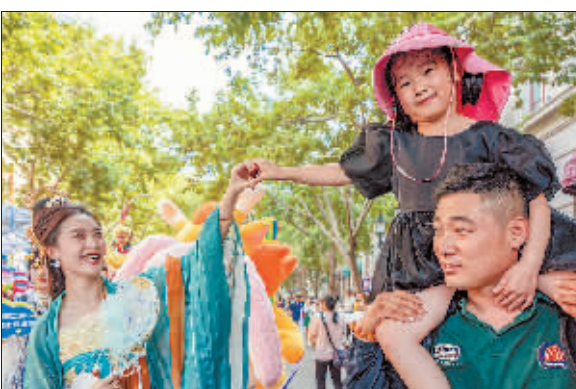
给你比心 作者:刘俊华