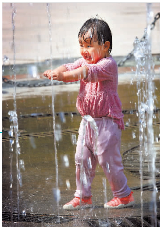
快乐童年 作者:葛刚(组照)