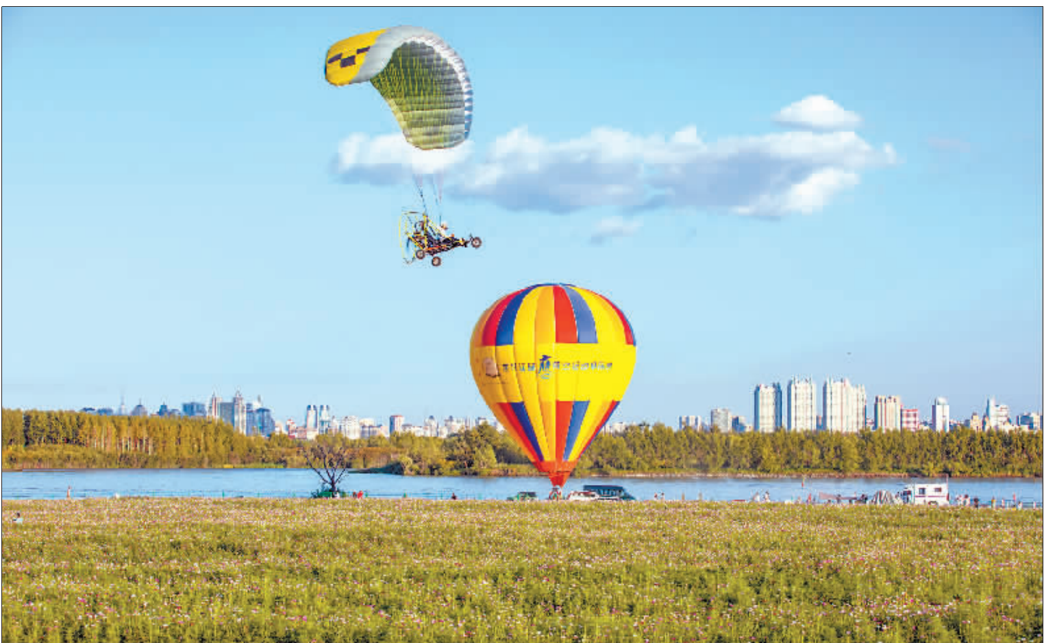
翱翔蓝天 作者:李军(女)