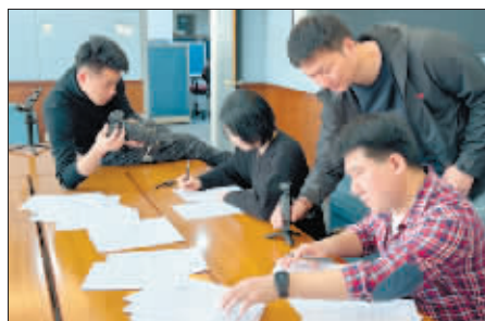
哈尔滨日报社记者手写书信。

在大会发布的32个党媒推动文旅融合高质量发展案例”中,“春风有信·再约‘尔滨’”位列第七。