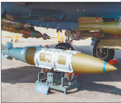
“杰达姆”精确制导炸弹。

近日，“美军史上最大规模泄密事件”引起关注。一个名为“战斗轰炸机”的俄文账号在社交媒体上宣布：“一家美国公司主动提供了超过250GB的美国军事装备数据”，并公布了其中部分文件，包括F-15、F-35战斗机以及多种无人机在内的大批美军装备的机密性能手册。美国《技术时报》称，类似的泄密事件近年来多次发生，可能会暴露美军装备的真正弱点。