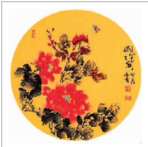
国画《多福》作者 贾湘曼