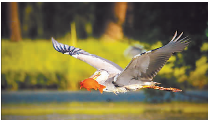
摄影《美餐》作者 刘敏