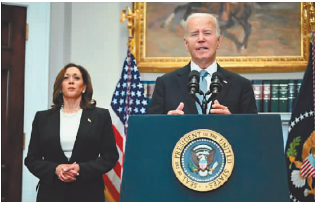
美国总统拜登支持哈里斯成为民主党总统候选人。