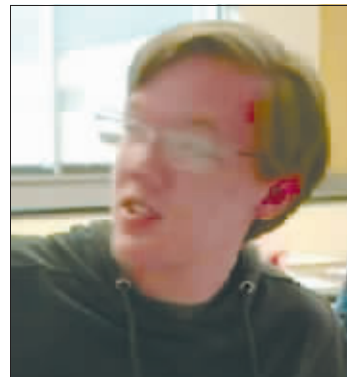
刺杀特朗普的枪手克鲁克斯。