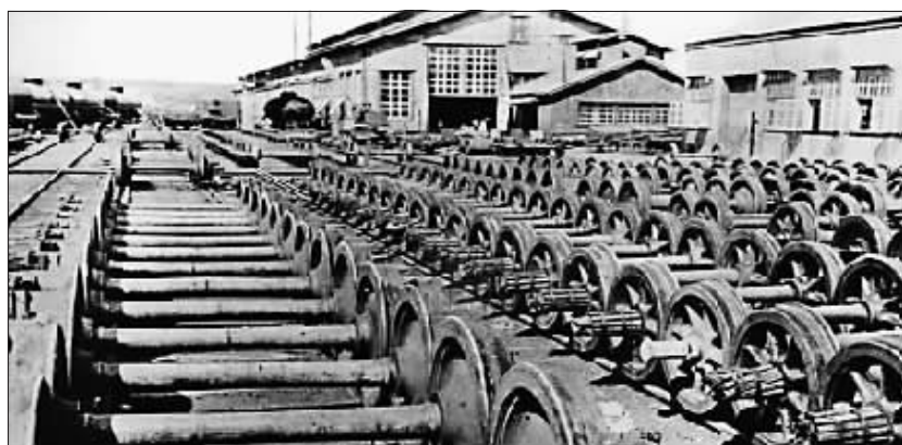
铁道工厂生产的轮对。

1940年1月，厂里担负一批改轮对、车勾任务。当时一些青年工人不知道日本人为啥改这玩意。但是，老厂的工人一看就明白，这是日本人准备进攻苏联。为了