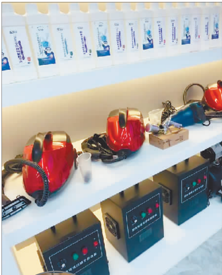
森家环保总部展厅内展示的除醛设备。