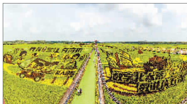
多彩稻田画

像印象派油画一样模糊的感觉，来自这座城市无法复制的美景。花海如诗，田野如画，这个季节，这里美得让人忘了归途，忘了时间。