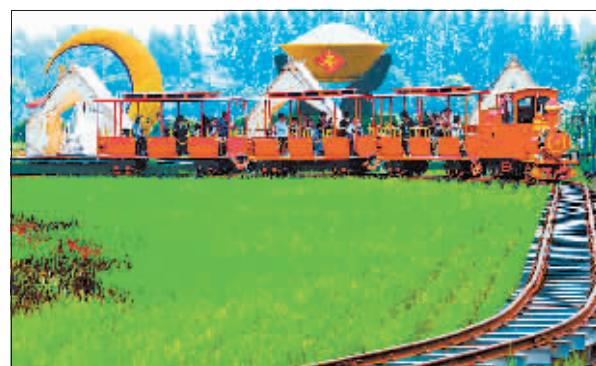
农场列车 湛卢 摄