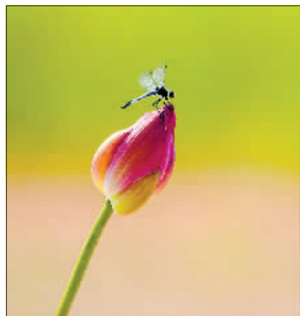
外滩湿地