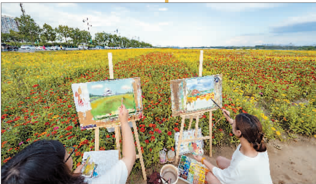
花海写生