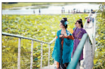
满目荷花