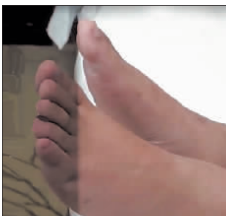
小安手术后左右腿长短不一样。