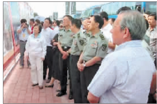
2012年夏季,作者陪同部分全国人大代表参观群力新区规划图。

文化品位和精神生活可以塑造一个城市的灵魂,没有文化的气息,再美的都市也会消沉。再说就说群力的音乐氛围,这里每天都在流淌优美的旋律,欢歌总是不停。这些不仅来自音乐公园、音乐广场、音乐长廊,也来自那个有着宝石般造型的音乐厅。这座音乐厅成了省城的音乐家园,每年两百余场的演出让它声名大噪,一流的设施让它蜚声内外,它用音乐的力量搅热了群力。