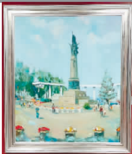
哈尔滨防洪纪念塔