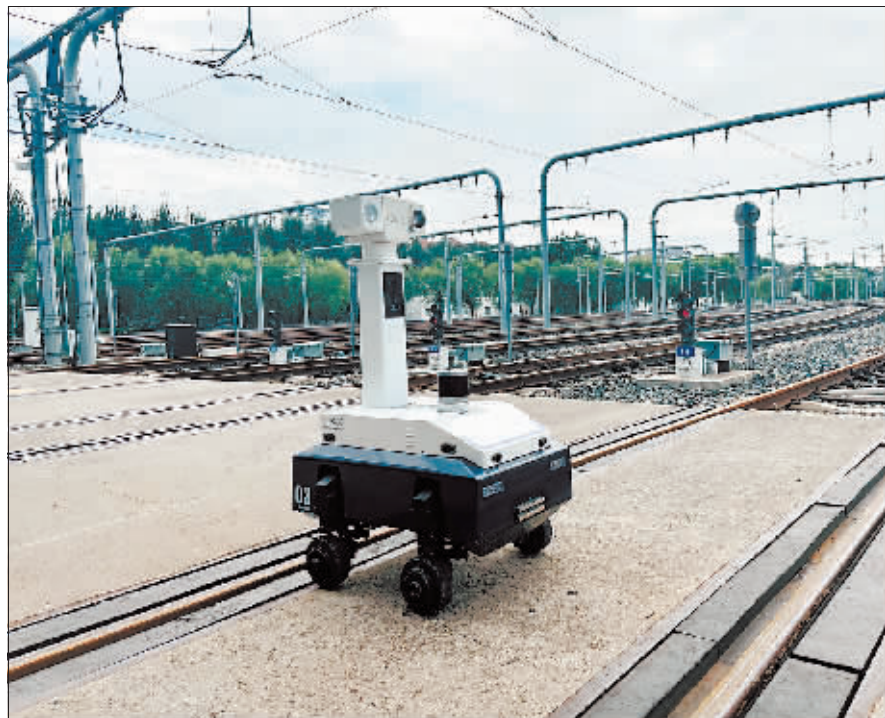
机器人在车辆段进行设备巡检。

每天车站运营结束后,智能巡检机器人可对站台、站厅等公共区域进行不间断巡检,减轻车站安防巡检压力、提升安防等级、节省人力成本和管理成本。 压变电室”“环控电控室”“系统通风机房”等使用场景进行了测试,其多种传感器能够有效监测设备的状态,进行高温预警、跑冒滴漏识别、人员入侵识别及智能读表等操作,确保设备间的安全和高效运行。在巡检过程中,如发现设备出现异常情况,机器人能够及时预警并自主生成巡检报告。此外,轨道里的巡检机器