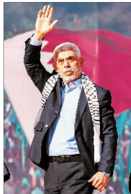
哈马斯领导人辛瓦尔。

然而，分析人士同时指出，对辛瓦尔的暗杀行动将让正在进行的加沙地带停火和人质释放谈判产生变数。“如果辛瓦尔被杀，他的继任者将更不愿与以色列进行谈判，因此结束巴以冲突会更加无望。”