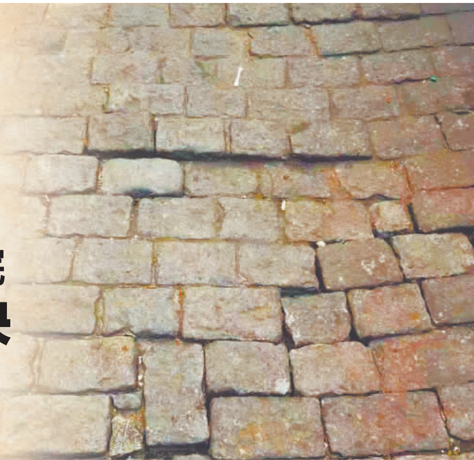
新晚报制图/田宇阳