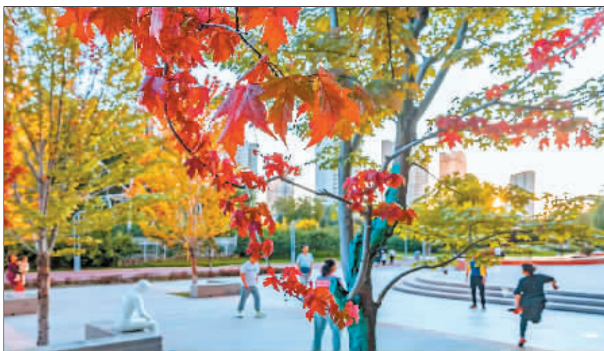
摄影《又见枫叶红》作者 张本盛