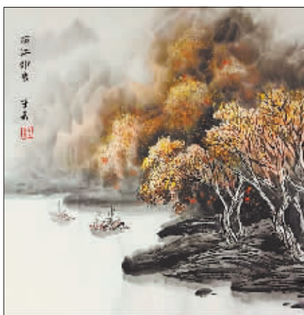
国画《西江印象》作者 子云