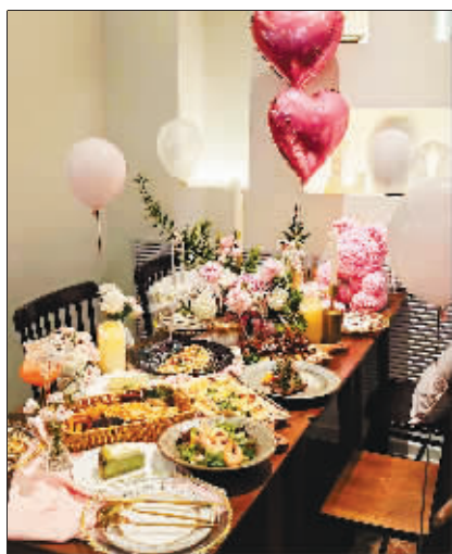
极具氛围感的餐厅。

作为一座文化底蕴与内涵丰厚的旅游城市,开放包容的哈尔滨一向喜欢接受新生事物,在消费领域也不例外。于是,一方面积极应变满足个性化的消费诉求,另一方面要在市场竞争中抛开“同质化”……哈尔滨的小店们在求新、求变的赛道上一路狂奔。