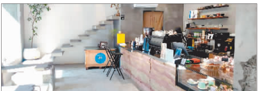
小店开始走多元化经营之路。