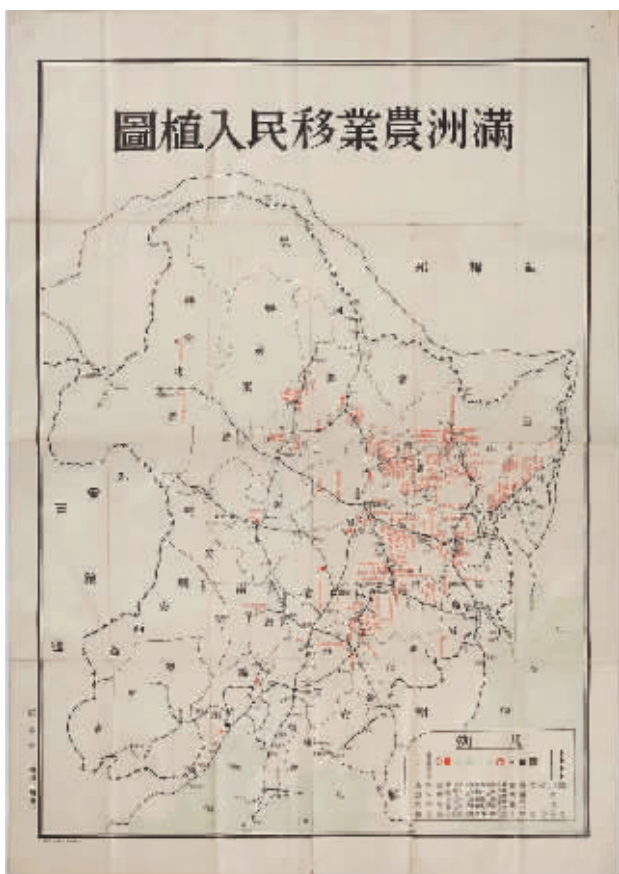
满洲农业移民入植图。

专家指出,日本侵略者在中国东北的移民史就是中国人民沉痛的血泪史,中华儿女进行了长达十四年的奋勇抗战。随着1945年日本战败投降,其控制东北、分裂中国的野心最终破灭。此次展出旨在呼吁社会各界缅怀先烈,铭记历史,珍爱和平,警钟长鸣。