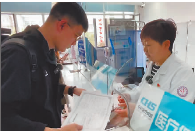
24日,哈尔滨市红十字中心医院与道里区社会保险经办服务中心签署协议,成为哈市首家可为新生儿一站式办理参保的定点医疗机构。图为市民在为新生儿办理医保。

业公司负责人表示,可以给出两个调解方案:一是周鉴自己修车,将发票交给A物业公司,A物业公司向上级请示同意后,对周鉴进行赔付;二是通过保险报案的方式向周鉴进行理赔。周鉴表示无论哪种方案他都可以接受,就希望物业公司能够给出处理期限,不希望一等再等。A物业公司负责人承诺,将在十五日内一定给出满意答复,至此双方握手言和。