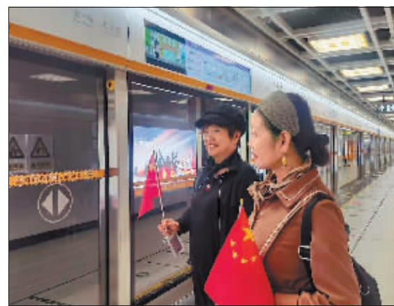
市民试乘地铁3号线道里段新站。