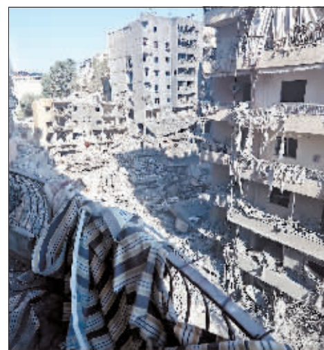
黎巴嫩首都贝鲁特南郊被以军空袭后的景象。

纳比勒·卡奥克在20世纪80年代加入黎巴嫩真主党，曾担任真主党在黎巴嫩南部地区的负责人，并经常代表真主党发表政治和军事领域的观点。以色列军方将卡奥克视为黎巴嫩真主党的高层成员之一，并称其直接参与和策划了近期对以色列的一系列袭击行动。