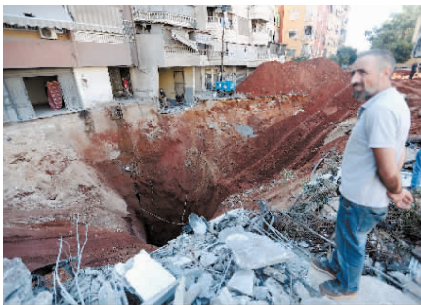
29日，在黎巴嫩首都贝鲁特南郊，一名男子站在空袭后的街道上。