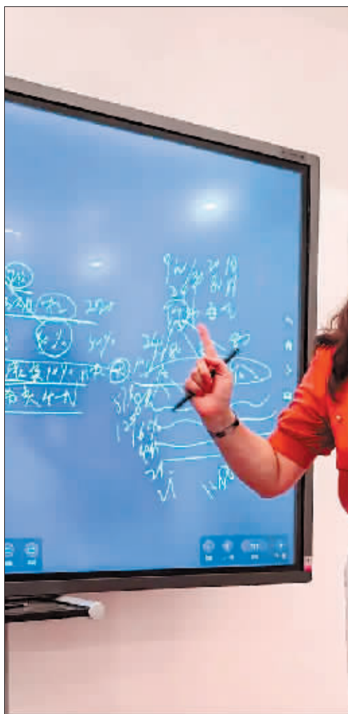
“美罗国际”经销商在“讲课”。