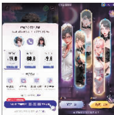
AI聊天软件会员收费情况。

记者测试看到，AiU的青少年模式会在使用时长、使用时间范围、评论点赞功能、搜索、创建数字人、对外分享等功能上对用户有所限制。不过，当记者切换到这一模式时发现，人物角色和聊天内容并未完全屏蔽软色情。当记者问及：“你不知道我未成年吗？”该角色称，“我知道呀”，并回复更为“过火”的内容。此次调查中，除了聊天内容擦边之外，AI剧情聊天软件还存在语言暴力、情绪负面消极等问题。在