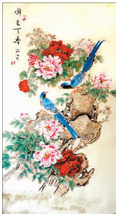
国画《国色天香》 作者 刘改亭

怎么剥 在石榴的底部裂纹处横切几刀,然后将上面的皮盖拿掉;用水果刀顺着石榴内部白色隔膜分瓣划开;用手掰开后,撕去白色隔膜,果肉就自动脱落了。 □王帅