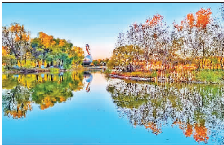
摄影《醉美秋色》 作者 陶滨