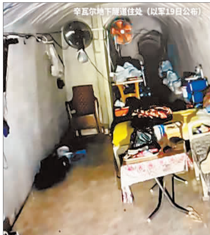
辛瓦尔地下隧道住处(以军19日公布)