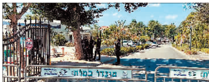
19日,内塔尼亚胡在凯撒利亚的住宅周边道路被封锁。

以色列总理府19日证实,内塔尼亚胡在凯撒利亚的私人住宅当天上午遭到无人机袭击。内塔尼亚胡和妻子当时都不在住宅