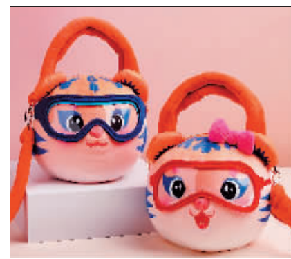
“滨滨”“妮妮”萌趣毛绒手提斜挎包

提到哈尔滨,很多人会联想到“搓大澡”“逛大街”和欧式建筑。为了让更多人感受到这座城市的中西合璧和朴实热情,专宠系列产品应运而生。3款以哈尔滨特有元素为背景设计的冰箱贴,让你随时随地都能感受到这座城市的温度,快把它们带回家吧。