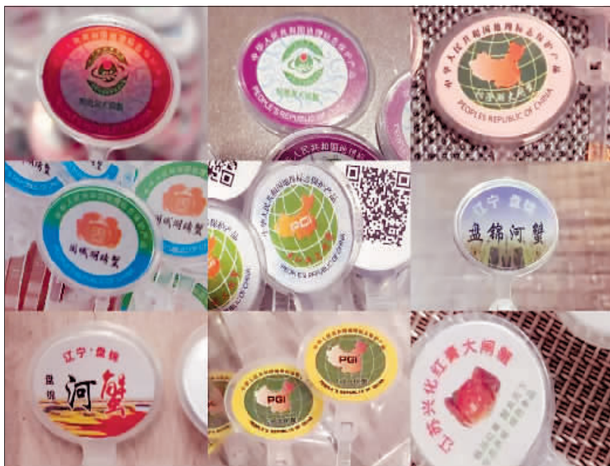
线上售卖的多款阳澄湖大闸蟹假蟹扣和其他产地蟹扣。