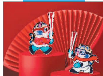
三款火炬系列纪念品。