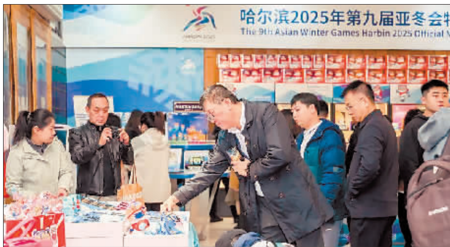
消费者在亚冬会特许商品零售店选购纪念品。

委会主办、北京工美集团承办的亚冬会倒计时100天特许经营文化活动在北京市工艺美术博物馆举行。以活动为契机,博物馆内亚冬会特许商品零售店正式开业,近百款亚冬会特许商品新品上市。