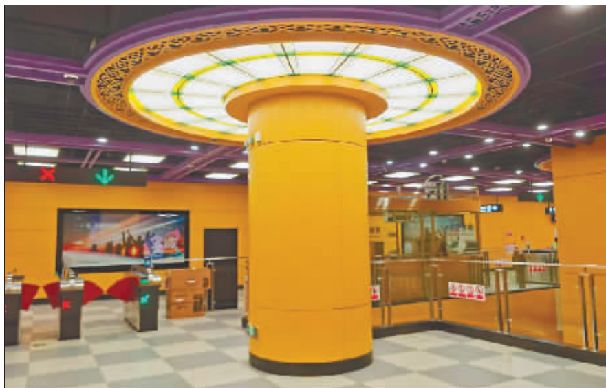
车站紫色与黄色相间的典雅时尚风格。