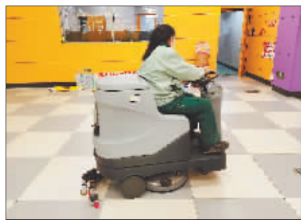
上海街车站工作人员正在进行保洁作业。