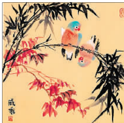
国画《鸟趣》作者 戚秀