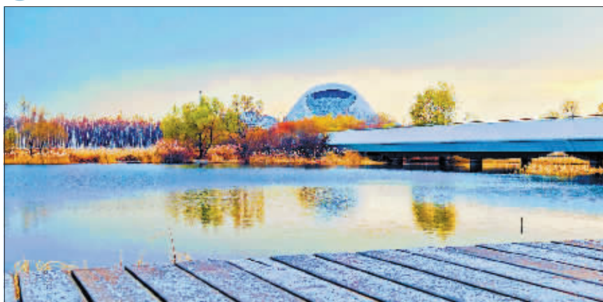
摄影《剧院初雪》作者 张晓青