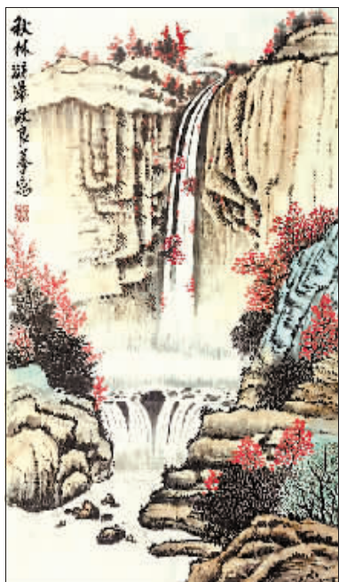
国画《秋林溅瀑》作者 杨致良