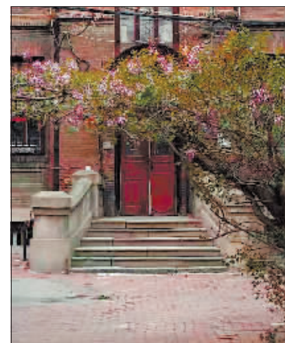
咖啡馆开在老街旁的俄式建筑里。

老建筑里的咖啡馆,提供的不仅仅是一杯咖啡,更是回忆与现代生活交织的“时光机”,承载着城市的文化记忆,让顾客感受到哈尔滨独特的底蕴和咖啡文化的积淀。