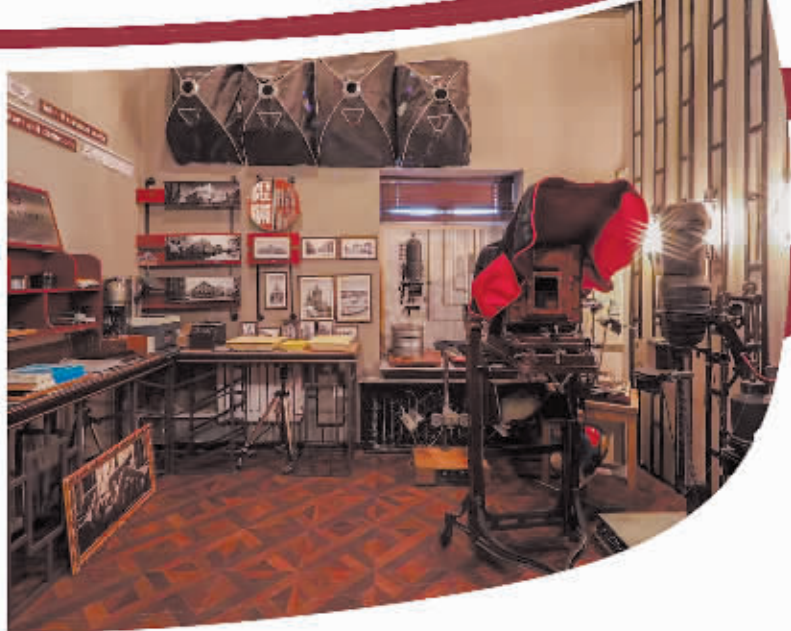
新晚报制图/宋占晨