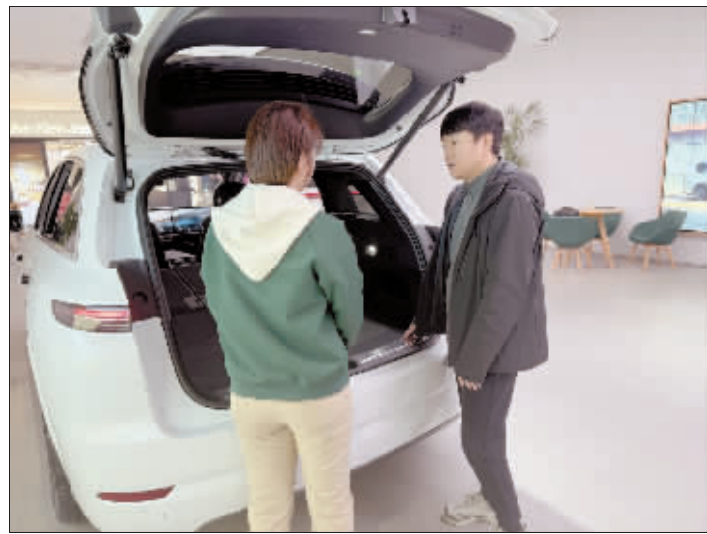
游客在挑选理想汽车。

“理想汽车致力于打造移动的家，创造幸福的家。目前，哈尔滨很多80后、90后，年龄在30岁至40岁的购车者都有家庭出行露营、游玩的需求，更倾向于选择SUV、MPV等空间较大的车型。理想汽车充分满足了他们的消费需求。”理想汽车相关负责人表示，目前所销售的部分车型设有三排座椅，可实现6人满载，方便带上孩子和老人一同出行。车上还配备了沉浸式影音系统，孩子们可以与车内的智能助手进行互动，家人还可以在车上看电视、K歌。车内充电面板、冷暖