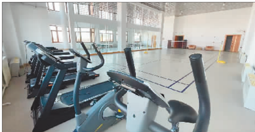
酒店为参赛运动员提供健身器材。