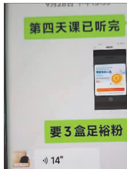
白先生父亲听完养生课后免费领取了三盒足浴粉。