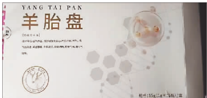
白先生父亲购买的羊胎盘等产品。